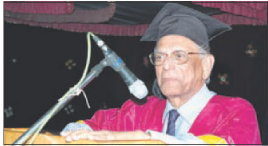
ప్రసంగిస్తున్న నిమ్స్ మాజీ డైరెక్టర్ డాక్టర్ కాకర్ల సుబ్బారావు

మంగళగిరి, న్యూస్ టైమ్: సమాజానికి సేవ చేసే అరుదైన అవకాశం వైద్యులకు మాత్రమే దక్కు